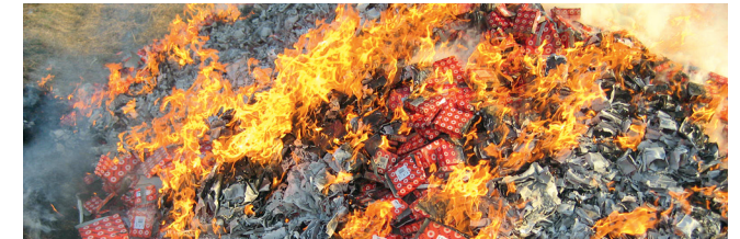
Yapılan baskınlar, ancak rulmanlar gerçekten imha edildiğinde başarılı olmaktadır: Burada sahte ambalajlar yakılıyor, aynı anda bir çelik atölyesinde rulmanlar eritiliyor.

Ayrıca fuarları ziyaret ediyor, internette araştırma ve daha pek çok şey yapıyoruz. Bu şekilde sahte rulman piyasasının nasıl yürüdüğünü ve bu rulmanların piyasaya girmemesini etkin olarak nasıl engelleyebileceğimizi daha iyi anlıyoruz.