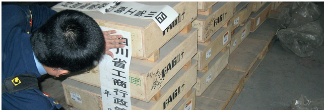
Üst resim: İçi boş, kırılmış yuvarlanma elemanı, servis ömrü boyunca önemli hasarlara neden olur Alt resim: Çin'deki yetkili merciler tarafından yüzlerce sahte büyük rulmanlara el konuldu

Avukat Ingrid Bichelmeir-Böhh Schaeffler Technologies AG & Co. KG